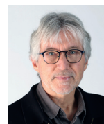
Yves MINO Photographe retraité